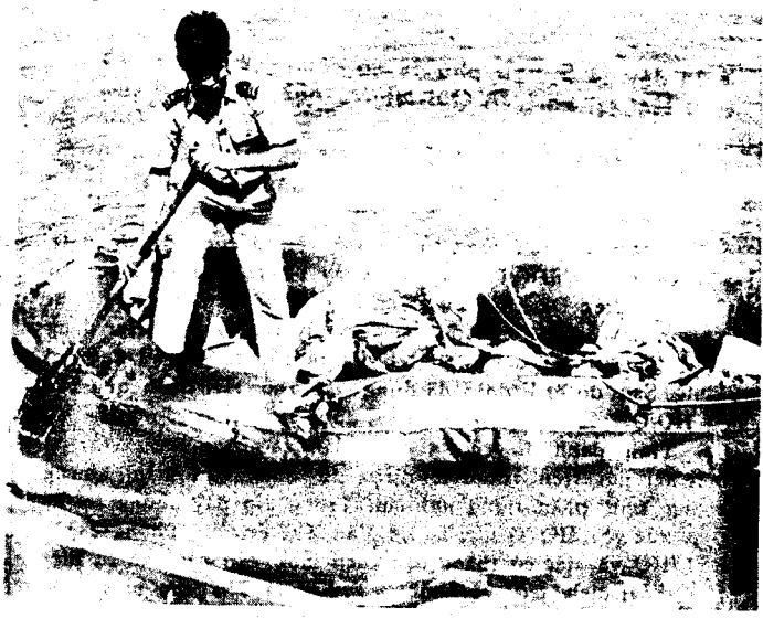
Chiếc xuồng cao su này đã được 15 Biệt Hải dùng làm phương tiện vượt biển Nam Hải. Nay được lưu giữ tại căn cứ Hải Quân Qui Nhơn.